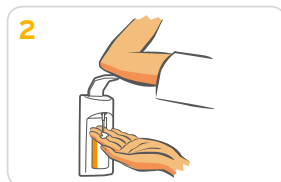
2 1-2 Pumpstöße auf eine Handfläche geben.