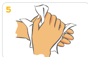
5 Hände gründlich mit einem Wegwerfhandtuch abtrocknen.