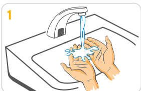
1 Hände mit Wasser anfeuchten.