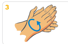
3 Handflächen aneinander reiben, bis sich Schaum bildet. Danach die Hände gründlich waschen.