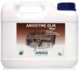
Aniosyme DLM Maxi 5 L Kanister

Tri-enzymatischer, mild alkalischer Reiniger für eine hervorragende Wiederaufbereitung von Instrumenten