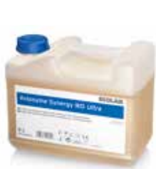
Aniosyme Synergy WD Ultra 5 Liter Kanister

Di-enzymatischer Reiniger für eine ultra Reinigungsleistung