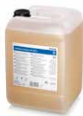
Aniosyme Synergy WD Ultra 20 L Kanister